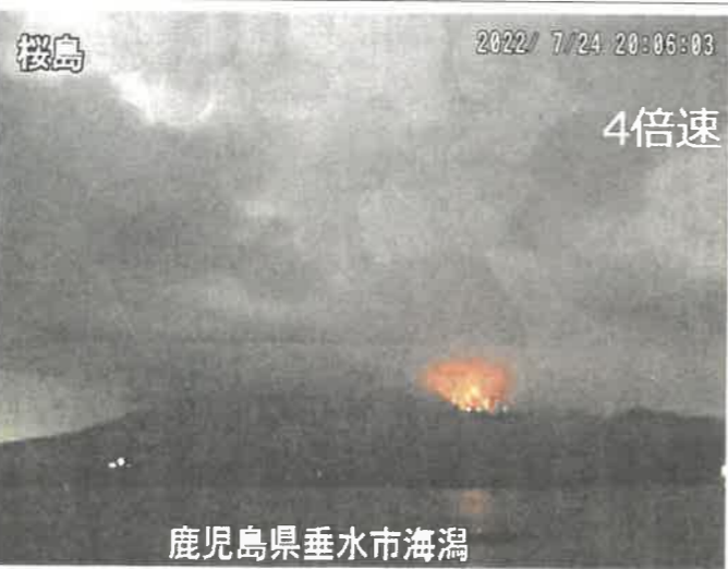
鹿児島県垂水市から望む噴火発生時の桜島＝24日夜(国交省大隅河川国道事務所の動画から)

気象庁は「大正噴火のような大規模噴火の兆候は認められない」としている。県警などが25日に噴石や降灰状況を調べた結果、人的・物的被害は確認されなかった。24日深夜から25日にかけて、3キロ圏にある島内の有村町と古里町の住民は島外に出たり避難所に身を寄せたりして過ごした。下鶴隆央市長は「26日にも一時帰宅できるように関係機関と協議したい」と表明した。桜島では18日から、山体の膨張を示すわずかな地殻変動が観測されていた。23日午後3時には4回噴火し、最高1200メートルまで噴煙が上がった。レベル5